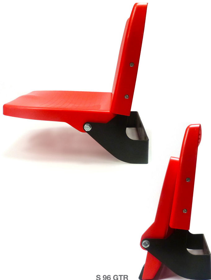
S 96 GTR