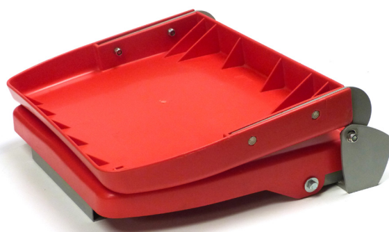
S 96 FG